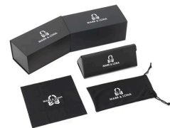
付属品：専用ケース/クロス