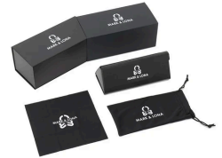
付属品：専用ケース/クロス