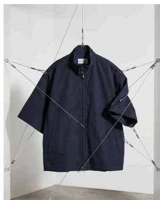
SHORT SLEEVE DRIZZ LER JACKET