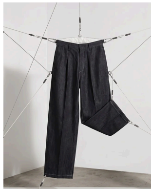
DENIM RELAX PANTS