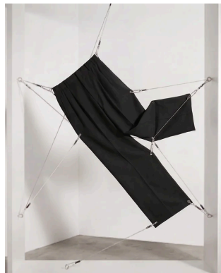
ELASTIC WAIST TUCK PANTS

「カジュアル」と「きれいめ」を自由に行き来する、洗練された現代的なミクスチャースタイルを提案します。