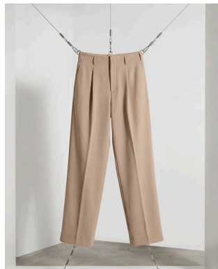
HOLLY WOOD TOP PANTS