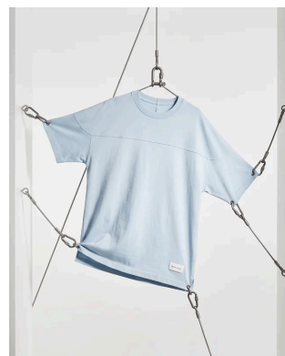
FOOT BALL TEE

都市を軽快に駆け抜けるスポーティーな軽さと、メンズの正統派な美学——その双方が奇跡的なバランスで調和した、モードコミュニーターと福菌英貴氏による特別なラインナップをぜひご体感ください。