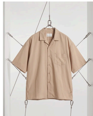
TENCEL OPEN COLLAR SHIRTS