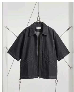
DENIM OVER SHIRTS