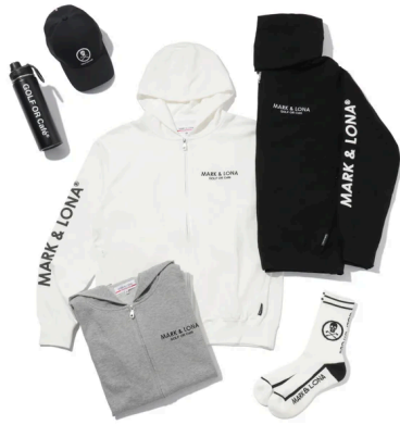
GOLF OR Café by MARK & LONA